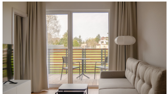
Rzeczywista aranżacja mieszkania nr 5