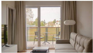
Rzeczywista aranżacja mieszkania nr 4