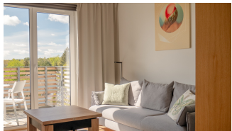
Rzeczywista aranżacja mieszkania nr 25