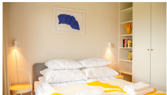
Rzeczywista aranżacja mieszkania nr 1